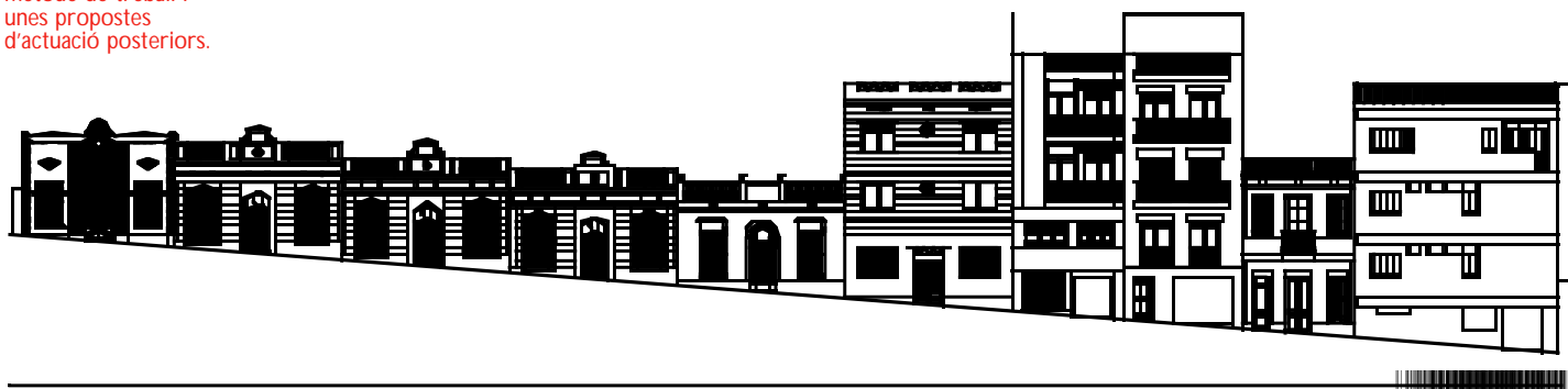
Aixecament d'un dels trams del carrer Verdi on s'està desenvolupant l'estudi. Il·lustració a partir dels plànols realitzats pels alumnes Olga Morató, Mireia Mas, Javier Valcarce i Pep Trias.

Un cop focalitzats a les zones pilot, hem procedit a l'aixecament de les façanes de cada sector per trams de carrer. Paral·lelament s'ha elaborat una fitxa per a cada edifici amb els continguts següents: fotografies, dibuix de la façana amb tots els seus elements, estat de conservació, catalogació patrimonial, materials, colors i una proposta d'intervenció. En relació al color, la millora del paisatge urbà de Gràcia no es concep de forma aïllada, edifici per edifici, sinó atenent a les relacions sintàctiques del conjunt.